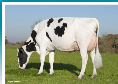
ROC HISTOR, abuela de Jarmon