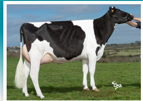
HOLDING, madre de Joystar