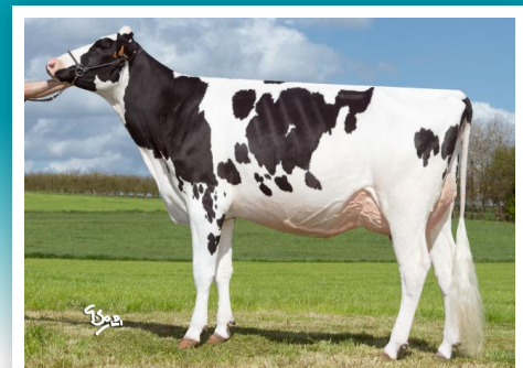
EDH IVORY, madre de Lifetime