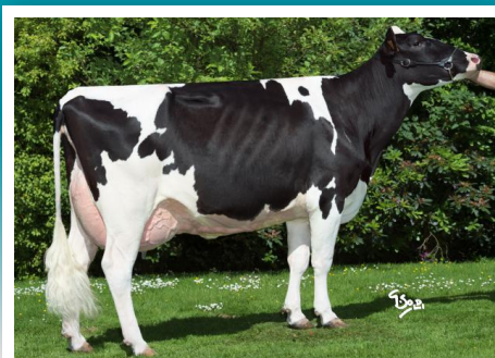
BBH GASHA, madre de Jagger