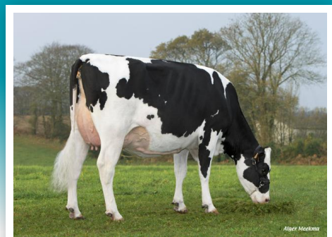
FAUVETTE 36, madre de Hurigny